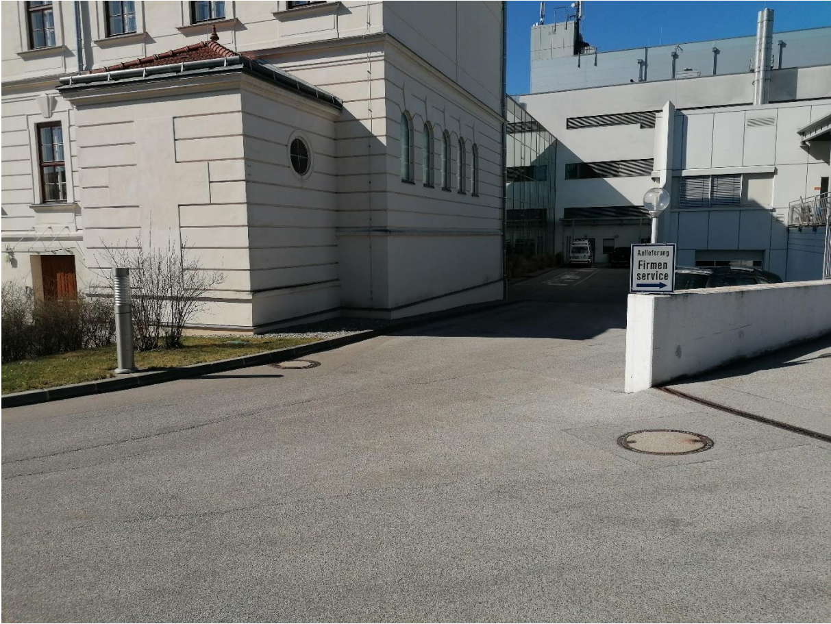
Innenhof wo ganz hinten der Eingang ist