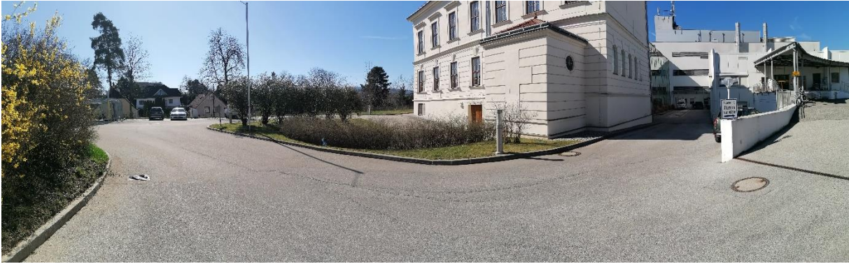
Panoramaaufnahme von Einfahrt (links) bis zum Innenhof (rechts im Schatten)